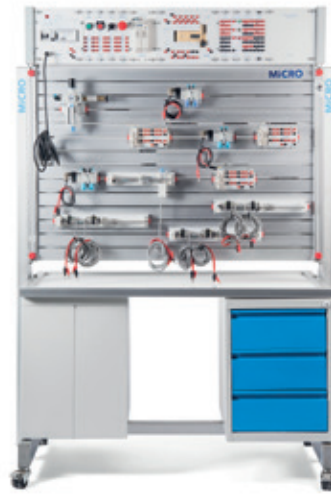
PANEL DIDACTO NEU PARA EJERCICIOS CON COMPONENTES Y LÓGICA NEUMÁTICA. PERMITE CAPACITAR EN FORMA PRÁCTICA Y METÓDICA EN LA TÉCNICA DE MANDO NEUMÁTICO, LA CUAL ES DE AMPLIA APLICACIÓN EN LAS AUTOMATI- ZACIONES INDUSTRIALES.