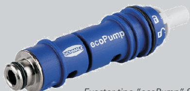
Ejector tipo "ecoPump" SEP.

Teniendo en cuenta que en el caso presentado se consideró la utilización de seis ventosas SPB4f 50 SI-55 SC090, con los datos del catálogo master de MICRO podrán determinarse tanto el diámetro (datos de diseño) como el volumen (datos técnicos) de ellas.