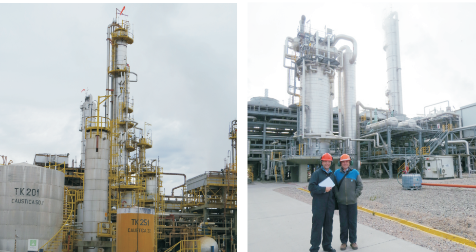
Agradecemos la excelente predisposición del cliente al permitirnos tomar fotografías en zonas clasificadas.

Para llevar a cabo con éxito este relevamiento, destacamos el acompañamiento de nuestro distribuidor Suministros Técnicos S.R.L. (Sumtec) de Neuquén.