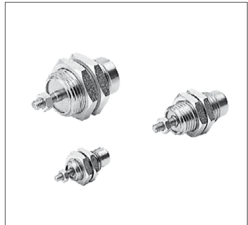
Códigos en Negrita : entrega inmediata, salvo ventas.

Se incluyen dos tuercas de montaje con cada cilindro